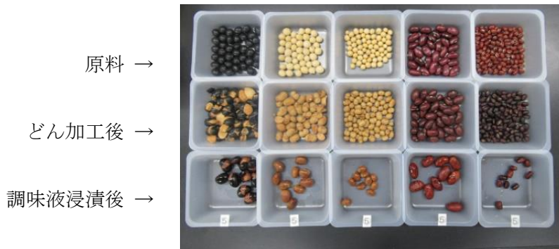
図5 ピクルス材料の外観

どん加工によって黒大豆の膨化に伴う皮切れ、剥皮はあったが、水浸漬、煮熟工程が無いために皮の色流れは抑えられ、全体的に乾熱による色の暗色化と種皮への固定が促進された。金時の色を色差計（日本電色工業㈱，SA-4000，マンセル表色系D65/2°，φ30mm丸形セル使用）を用いて測定した。結果を表5に示した（L*は明度、a*は赤色度、b*は黄色度を示す）。試作したピクルスの金時豆は市販品と比較して色の濃い赤色を示す数値であった。