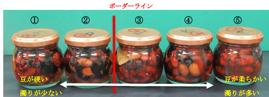
図7 配合別調味液を加熱充填した試作品