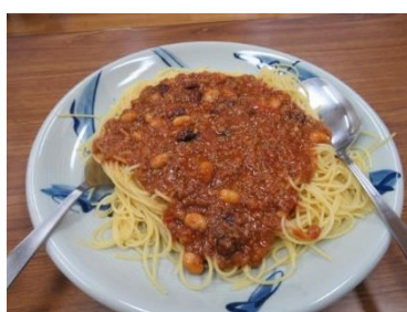
図 1 パスタソース試作品

炊き込みご飯の素は JA 本別町の希望で洋風とした。洋風の配合はベル食品(株)にレシピを委託した。1 回目の試作品は十勝産の鶏肉、マッシュルームを副材料に黒大豆主体のものが提供された。試食会では味は好評であったが、外観が和風のように見えるため、豆をユキシズカ 1 種類に指定した。また、さらに洋風な外観に仕上げるため、豆、人参の量を増量するとともにターメリック配合により明るい色調となった。ユキシズカは小粒大豆であるため煮えやすいことが予想されたが、ご飯を炊き上げて混ぜても豆が潰れない試作品が完成した（図 2）。