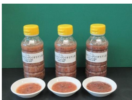
図3 最終試作品の画像(左から Q,R,S)