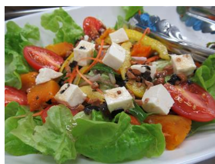
図4 黒大豆ドレッシングの使用例