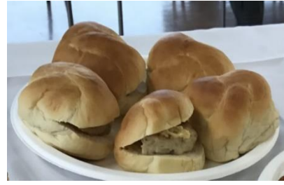
c) ハンバーガー (パテ部分)