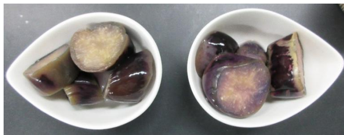
図 2 試作した茄子の浅漬けの外観（左：対照区、右：試験区）